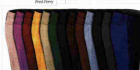
Horwast & Blafue